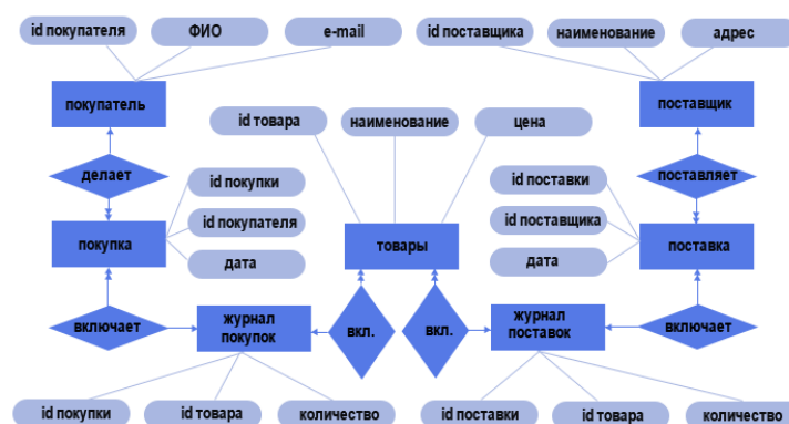
Рисунок 1 – Концептуальная модель предметной области «Продажи товаров»

Доставка разных товаров может производиться способами, различными по цене и скорости. Нужно хранить информацию о том, какими способами может осуществляться доставка каждого товара, и о том, какой вид доставки (а соответственно, и какую стоимость доставки) выбрал клиент при заключении сделки.